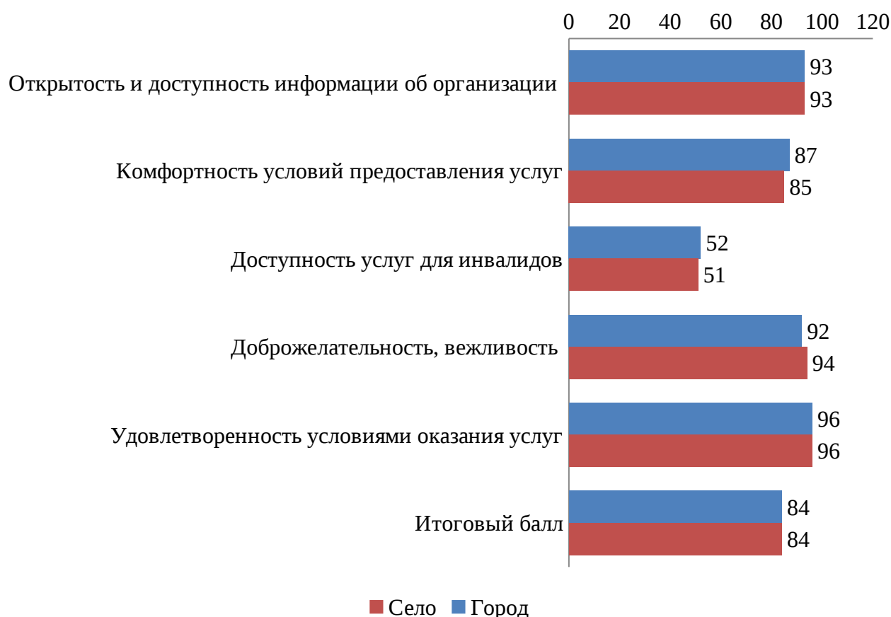
Рисунок 6 - распределение организаций дополнительного образования Свердловской области в разрезе типа населенного пункта, средний балл.

При анализе средних баллов в разрезе село/город можно сделать вывод, что результаты отличаются незначительно, однако более высокие баллы в городе по критерию «Комфортность предоставления услуг» и «Доступность услуг для инвалидов». В селе более высокие баллы по уровню доброжелательности и вежливости сотрудников образовательных организаций.