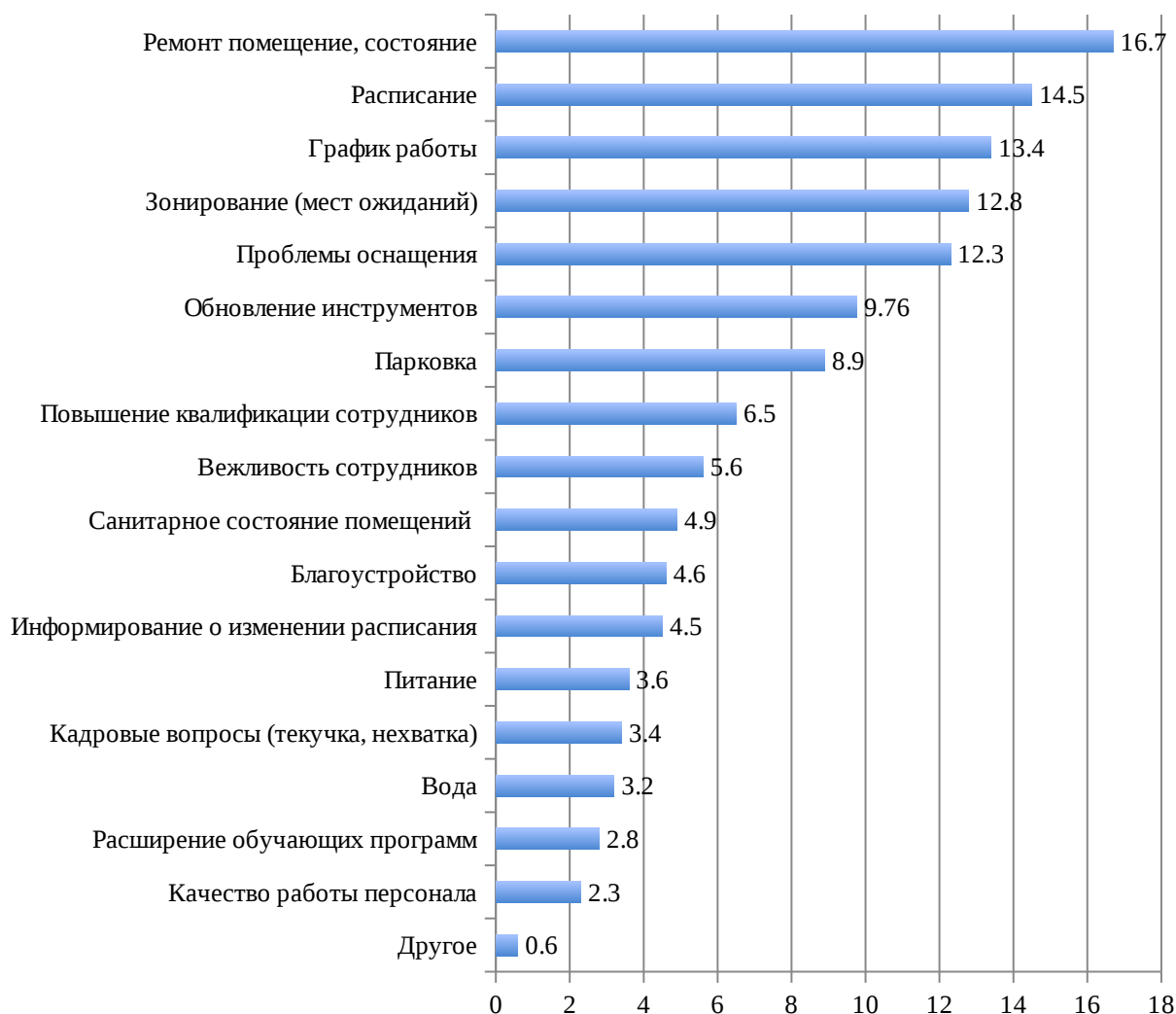
Рисунок 7 – Пожелания респондентов, в %

Основные замечания получателей услуг касаются следующих ключевых блоков: