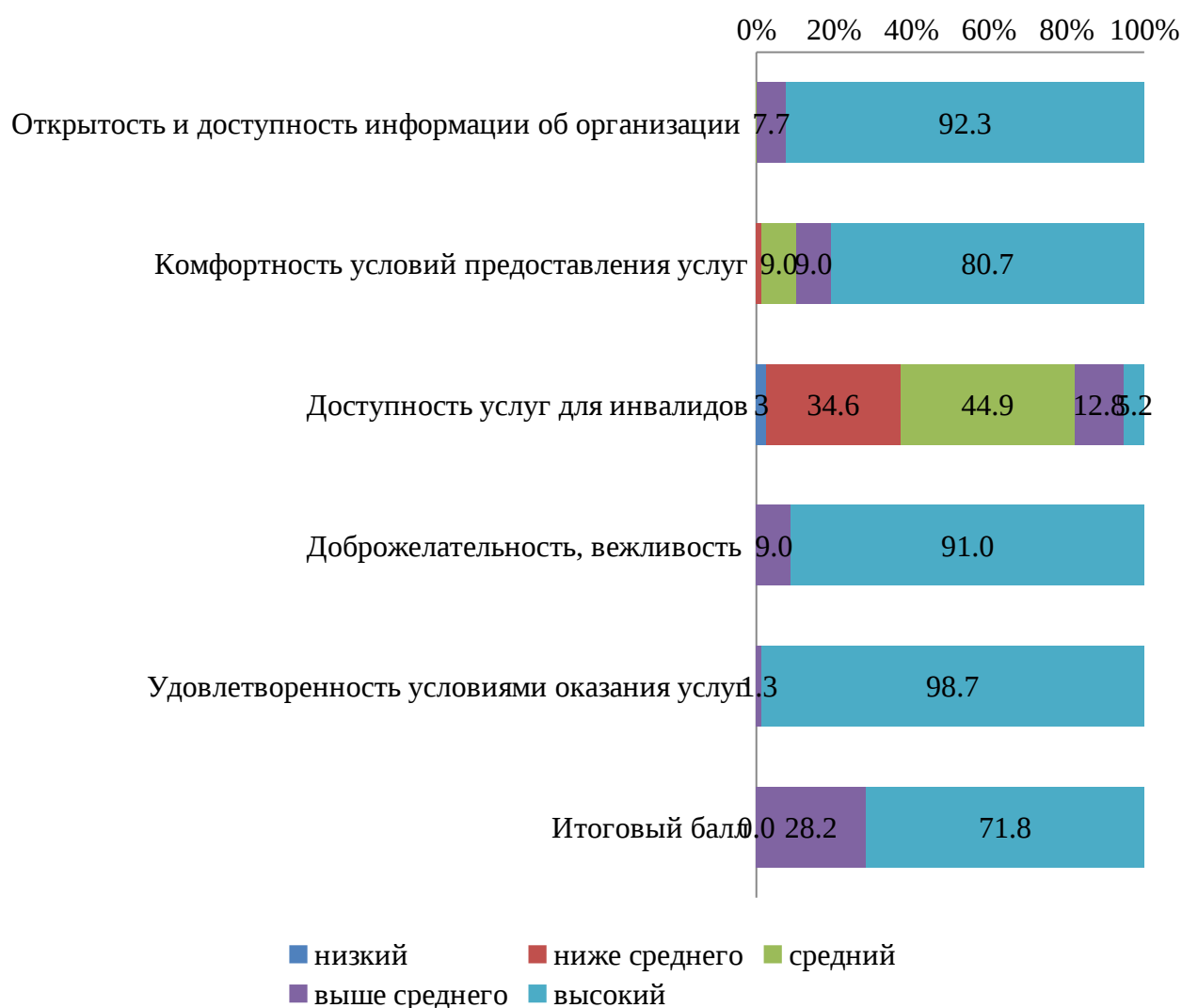
Рисунок 4 - распределение организаций дополнительного образования ГО Екатеринбург, %