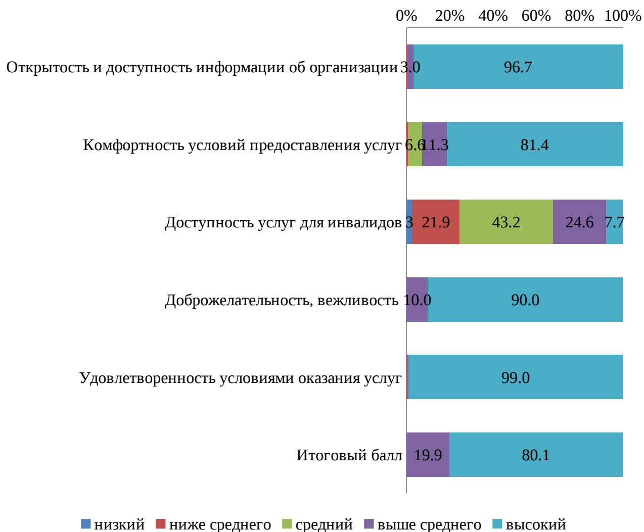
Рисунок 5 - распределение организаций дополнительного образования Свердловской области кроме ГО Екатеринбург, %

На диаграммах отражено распределение организаций по баллам в процентах от общего количества.