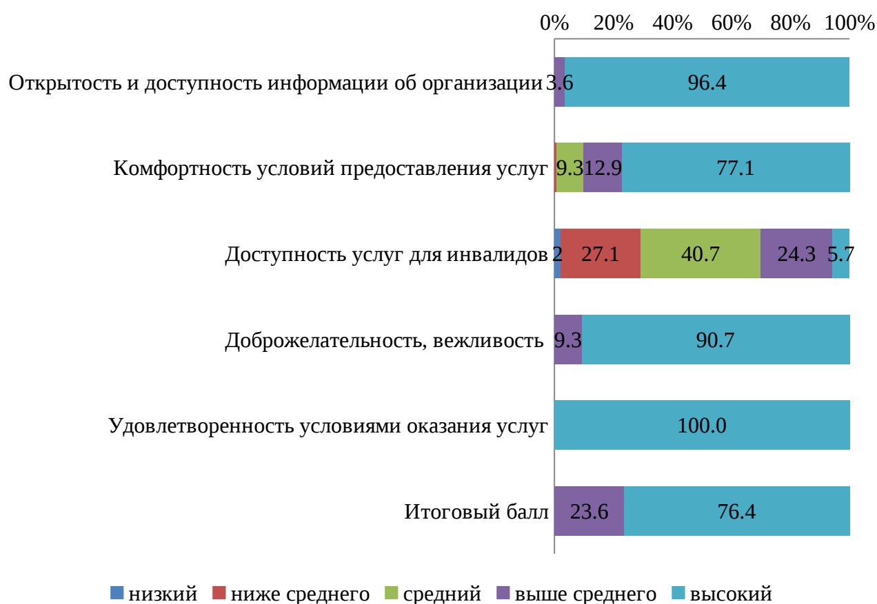
Рисунок 3 - распределение организаций дополнительного образования Свердловской области в селе, %.

Результаты НОК организаций в разрезе ГО Екатеринбург и Свердловской области отражены в таблице 5,6.