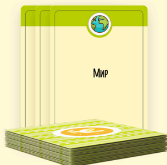
Вторая колода со словами