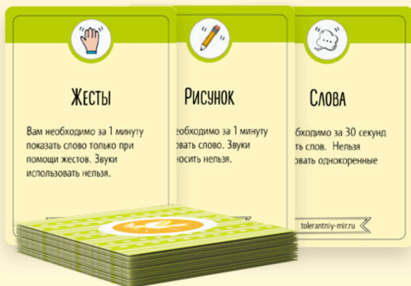
Первая колода с типами заданий